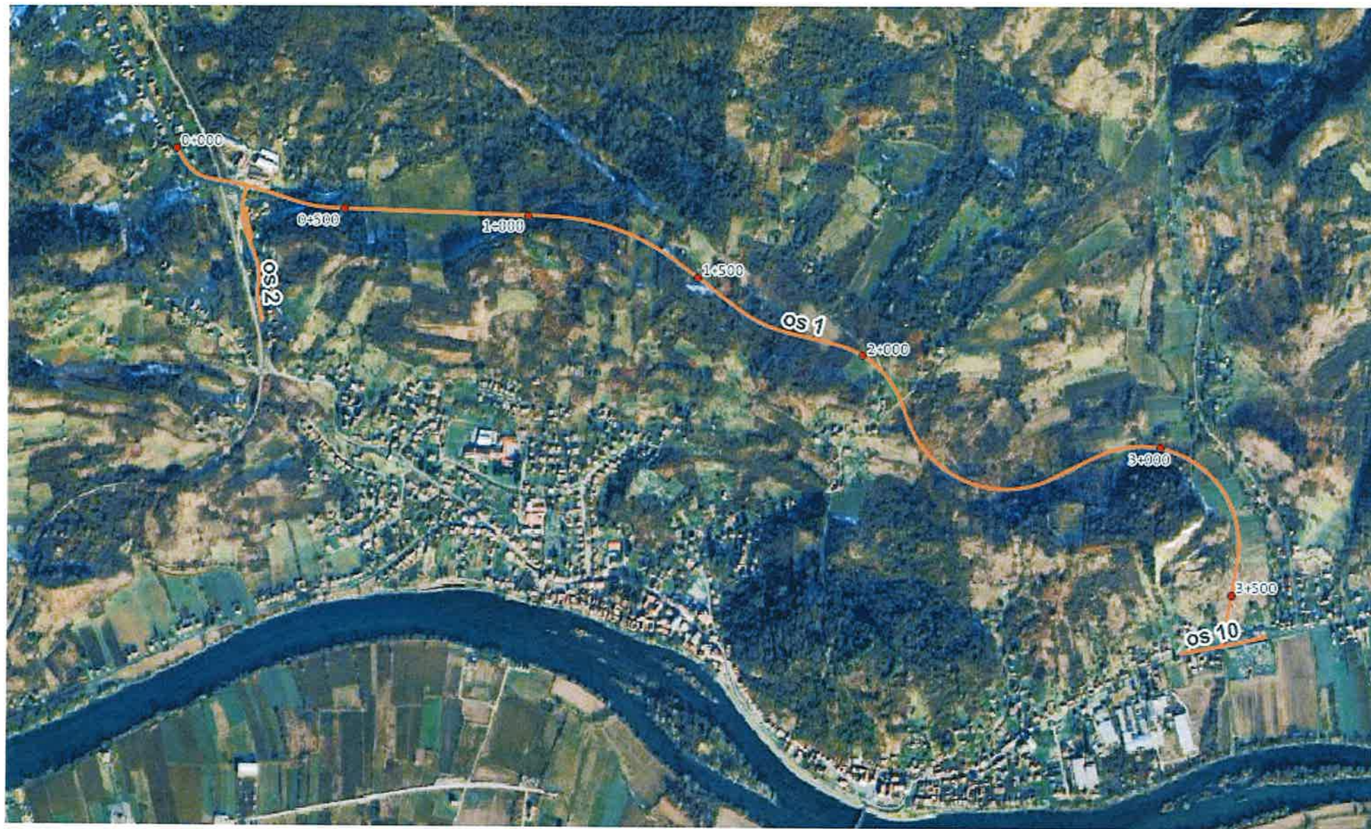
Grafički prikaz 1: Planirani zahvat na ortofoto podlozi