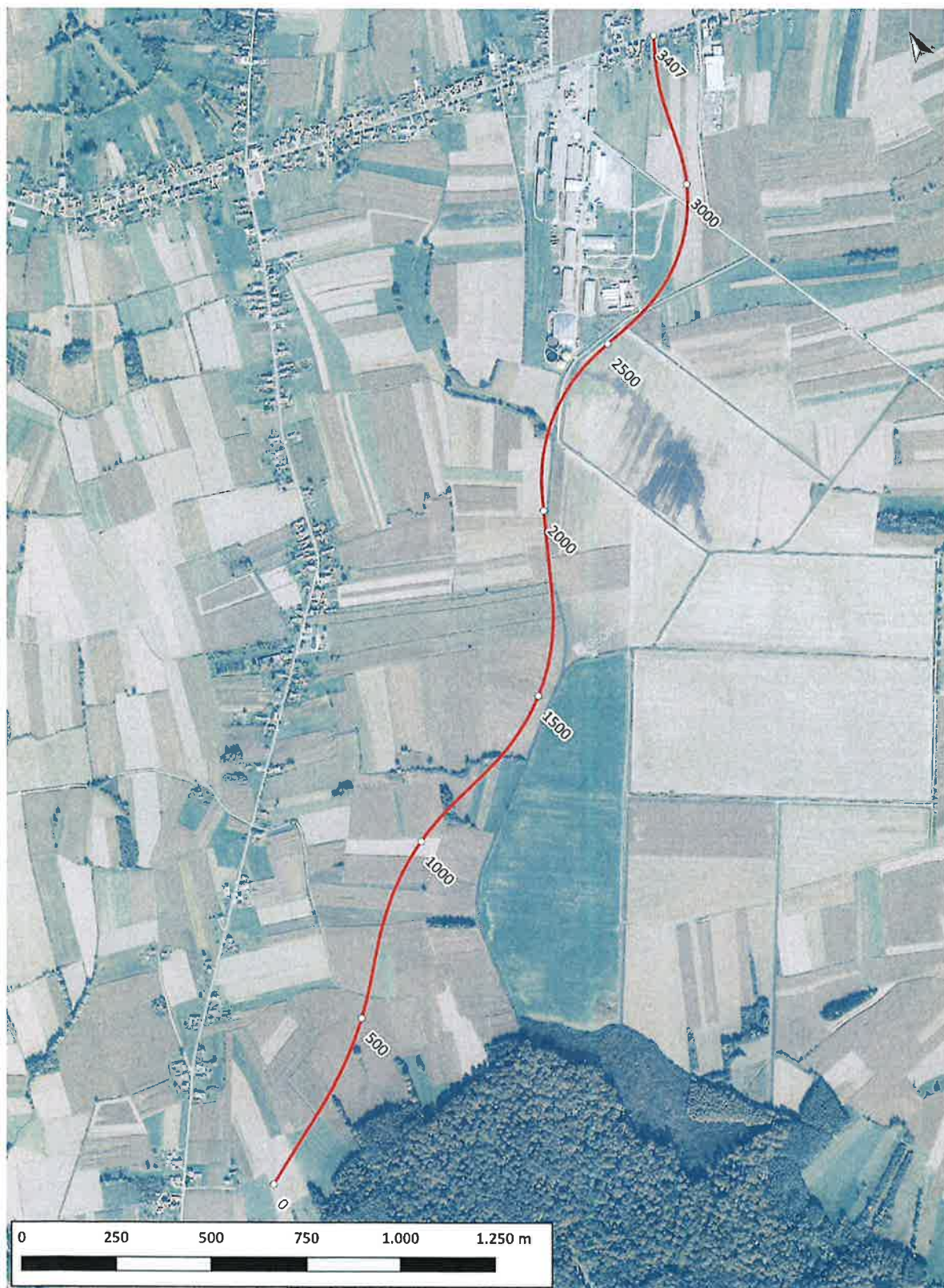
Grafički prikaz 1: Planirani zahvat na ortofoto podlozi